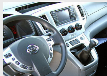
Nissan Connect beépített navigációs rendszer; Automata légkondicionáló; Fűthető ülések