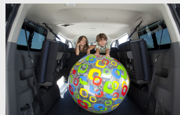
Teljesen kárpitozott belső tér