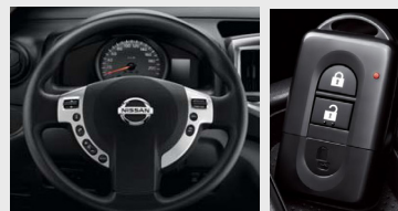
Sebességtartó automatika sebességátaróólóval